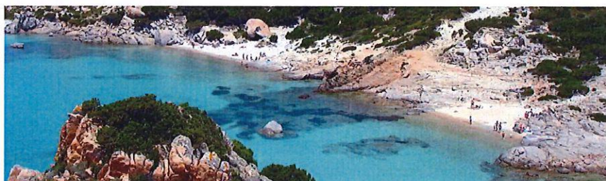
Ile de la Maddalena

Départ de Palau , joli petit port, et brève traversée jusqu'à l'île de la Maddalena , l'une des sept îles granitiques composant cet archipel sculpté par les vagues.... Visite de l'îlot de Caprera , dernier lieu de résidence de Garibaldi, le fameux unificateur de l'Italie. Déjeuner sur l'île de la Maddalena. Puis