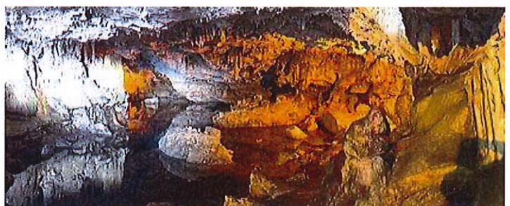
Grotte de Neptune

Petit arrêt à Alghero avec ses ruelles étroites pavées de galets ronds, ses arcs