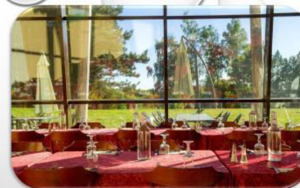
Village de vacances VTF Le domaine des Puits