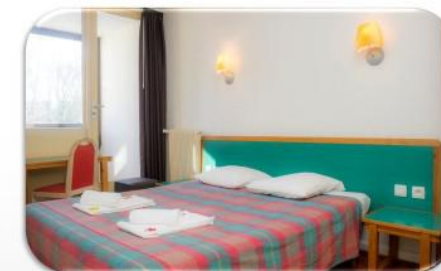
Hôtel *** 63950 SAINT SAUVES D'AUVERGNE